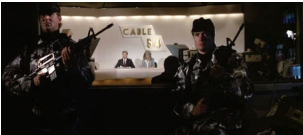
Televizní stanice „Kabel 54“ je používána vetřelci k hypnotizování lidí. Je toto science-fiction? Těžko.

Nada zjišťuje, že jediným způsobem, jak zachránit lidskost ze sevření vetřelců, je dostat se na střechu budovy televizní stanice a vyřadit z provozu vysílač podprahových zpráv, maskovaný jako satelitní anténa. Bez masmédií kontrolovaných elitami bude indoktrinace mas pochopitelně mnohem složitější. Takže se Nada s Frankem vypraví prostřílet si cestu vzhůru na střechu... nesnadný úkol. Dezinformační agent Nada potkal Holly Thompsonovou, výrobního manažera Kabelu 54, už na počátku jeho řádění. Nada vypadá, že se do ní zamiloval, ona je však zdrojem neustálých potíží. Ačkoliv se tato dáma zdála být na začátku přátelská, pokusila se Nadu během jeho cesty odvést, svést z cesty a dokonce ho zabít.