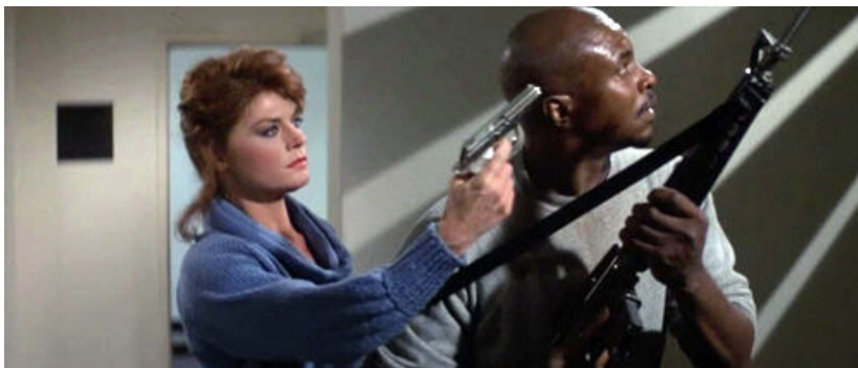
Nakonec střílí kámoše Franka do hlavy.

Nada zjišťuje, že jediným způsobem, jak zachránit lidskost ze sevření vetřelců, je dostat se na střechu budovy televizní stanice a vyřadit z provozu vysílač podprahových zpráv, maskovaný jako satelitní anténa. Bez masmédií kontrolovaných elitami bude indoktrinace mas pochopitelně mnohem složitější. Takže se Nada s Frankem vypraví prostřílet si cestu vzhůru na střechu... nesnadný úkol. Dezinformační agent Nada potkal Holly Thompsonovou, výrobního manažera Kabelu 54, už na počátku jeho řádění. Nada vypadá, že se do ní zamiloval, ona je však zdrojem neustálých potíží. Ačkoliv se tato dáma zdála být na začátku přátelská, pokusila se Nadu během jeho cesty odvést, svést z cesty a dokonce ho zabít.