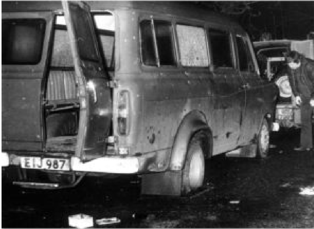
Kulkami provrtaný mikrobús, který vezl dělníky

Nairac a jeho skupina ve zvláštní průzkumné jednotce jsou podezřívání z toho, že řídili „ Glenanne gang “, skupinu složenou z členů lojalistických polovojenských eskader smrti, UDR, a sloužících členů policejních sil Severního Irsku (RUC – Královská ulsterská policie). V roce 2007 bylo odhaleno, že tato skupina plánovala „odvetný“ útok za masakr Whitecross, během kterého by bylo zavražděno 30 dětí na základní škole v malé vesničce Belleeks. Plán byl odvolán, protože členové skupiny měli podezření , že muž, který navrhl provést útok, pracoval pro britskou vojenskou zpravodajskou službu a že jeho záměrem bylo vyprovokovat občanskou válku.