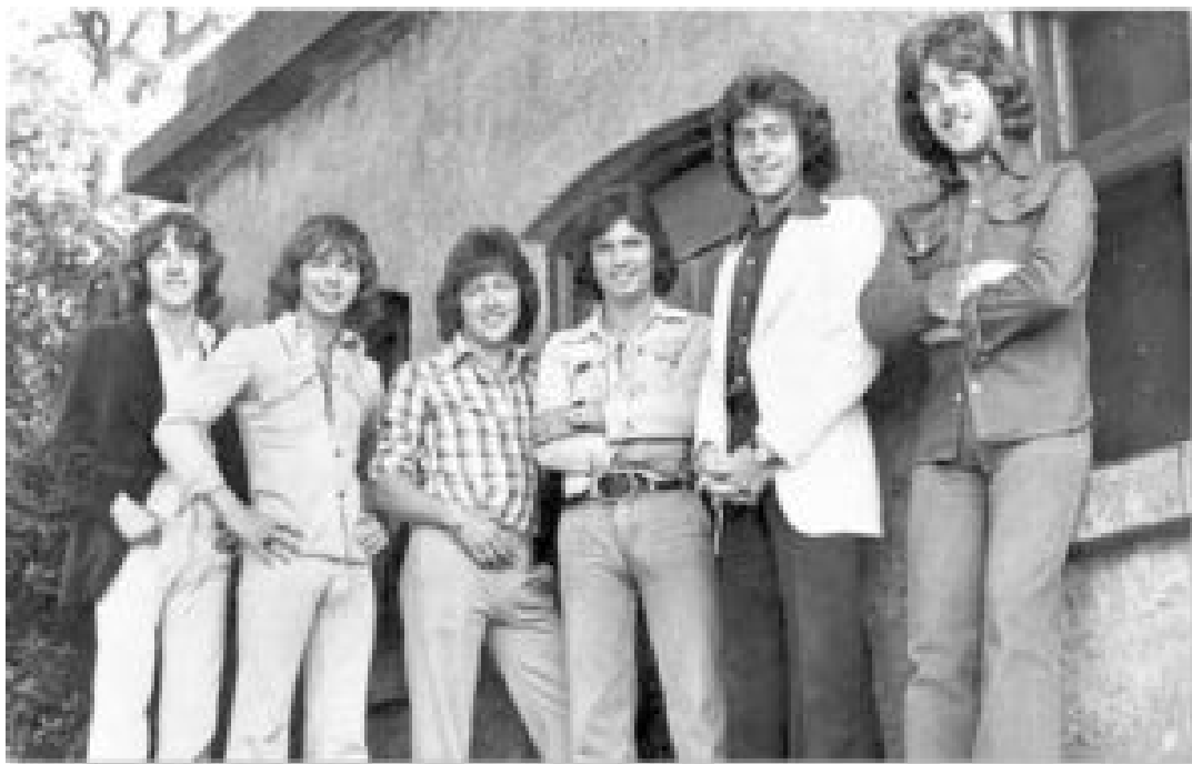
Šest členů skupiny The Miami Showband

Nedávno zveřejněné dokumenty britského ministerstva obrany odhalily , že muž s „ostrým anglickým přízvukem“ byl kapitán Robert Nairac ze zvláštní průzkumné jednotky, divize spadající pod zpravodajský sbor britské armády, která se podílela na tajných operacích v civilu v Severním Irsku od 70. let 20. století. Redigované dokumenty také ukazují, že Nairac byl zodpovědný za plánování a provedení útoku na Miami Showband .