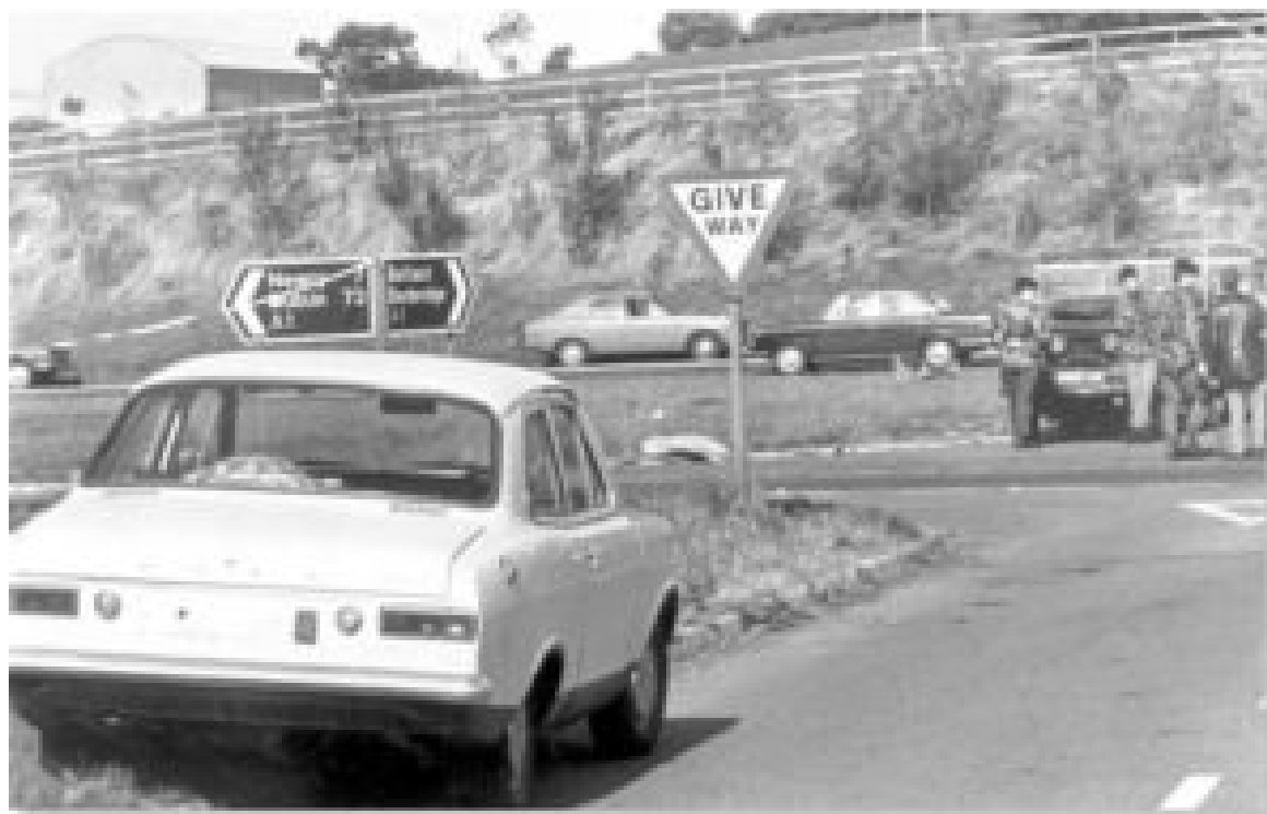
Jeden z vozů použitý střelci při vraždě členů skupiny Miami Showband

„přirozeně“ vyvinul a očernil by jejich jména a vyvinul tlak na irskou vládu, aby zvýšila kontrolu nad pohybem IRA přes hranice.