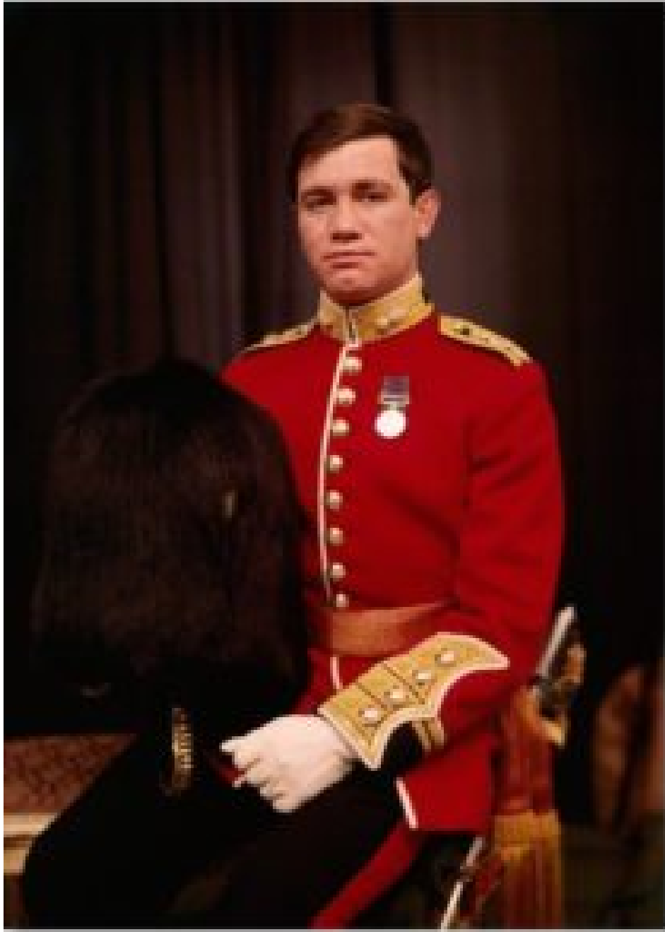
Kapitán Robert Nairac z Grenadierské gardy, později velitel jednotky britské eskadry smrti v Irsku během 70. let 20. století