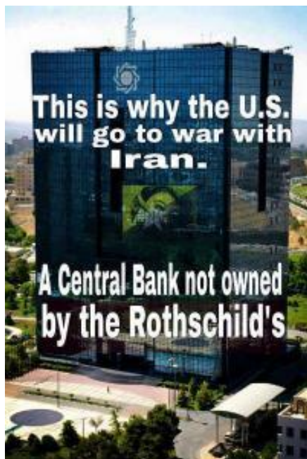
Íránská centrální banka

A to je velmi důležitá otázka, protože právě tou se vracíme k roli židů - roli Izraele. A to nikoliv jen ve vztahu k Rusku, ale i k celé biblické, tzn. judaistické a křesťanské kultuře, která je v zájmech “architektů světa” právě odsuzována k zániku.