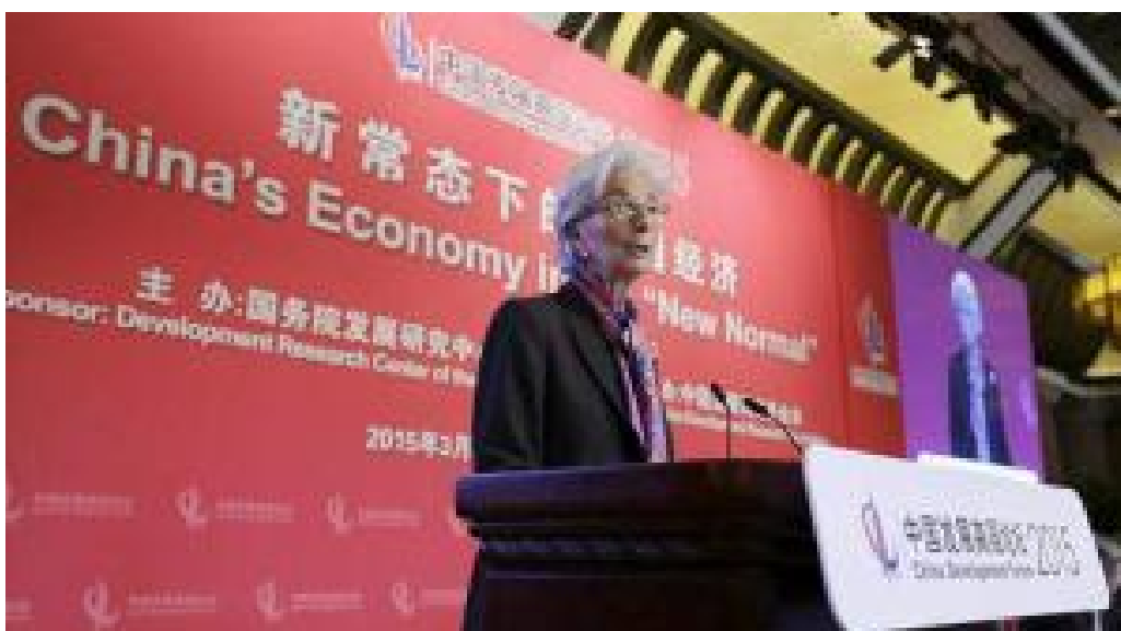
Lagardeová, Čína, březen 2015, New Normal

Tyto reformy vedou k pomalejšímu, bezpečnějšímu a udržitelnému růstu dobrému jak pro Čínu, tak pro celý svět, protože jejich osudy se prolínají. Ve skutečnosti tak Čína vytváří „ Novou normu “ nejen pro vlastní hospodářství, ale také velmi přispívá k celosvětovému dobru – přispívá k jeho ekonomické a finanční stabilitě, k udržitelnosti životního prostředí ukazuje multilaterální přístup, reagující na naléhavé globální problémy dnešního světa. Čína pochopila, že nikdo nemůže uspět sám. A to je důvod, proč je MMF hrdým hostitelem čínských ekonomických snažení doma i na hranici klienta. Těší se na plodný rozhovor tady v CDF. Děkuji. “